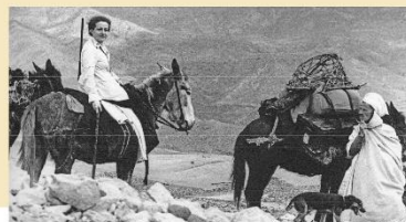
Sur le route entre Tadomont et Abziss, hiver 1939-1940