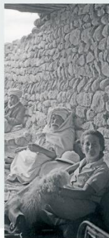
Dans les Aurès, hiver 1939-1940

L'étude de la généalogie de chacune des familles lui permet d'appréhender l'ensemble de la vie économique et sociale de cette population.