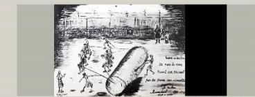
Le témoignage avec le soutien à Ravensbrück en 1942 - dessin de Frédéric Mexand