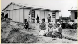
Un centre social en construction dans un bidonville.

Après quinze ans d'éloignement, Germaine Tillion revient en Algérie à la demande de Louis Massignon, son maître et ami, pour enquêter sur le sort des populations civiles. Puis elle entre dans le Cabinet du Gouverneur général, Jacques Soustelle.